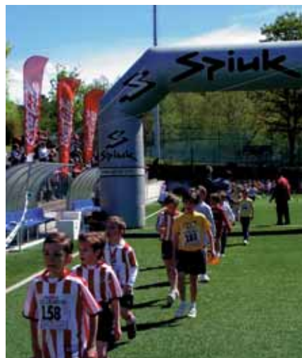
Alumnos de 1º y 2º Educación Primaria.

Si no llegamos a cubrirlo parte de esas necesidades quedan sin cubrir.