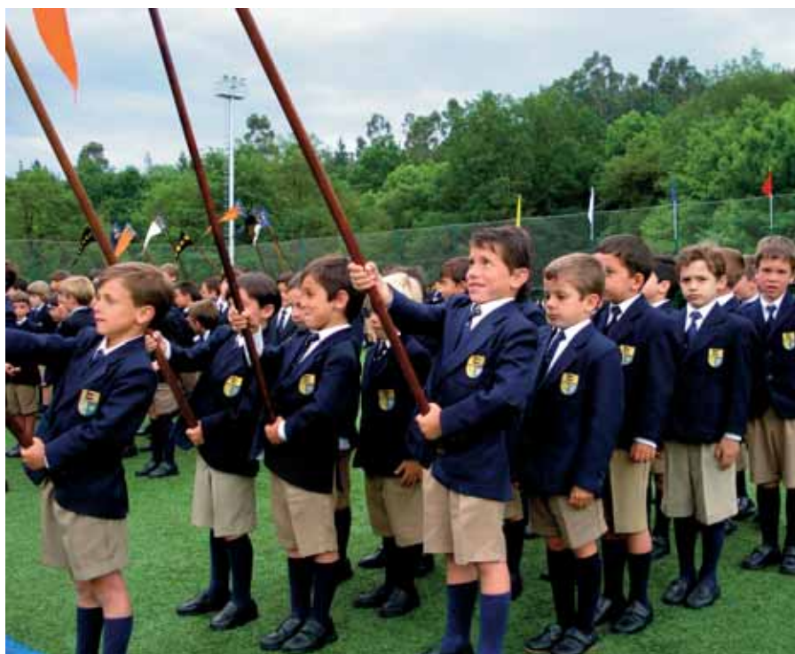
Alumnos de 1º de Educación Primaria en su primer desfile en el colegio.