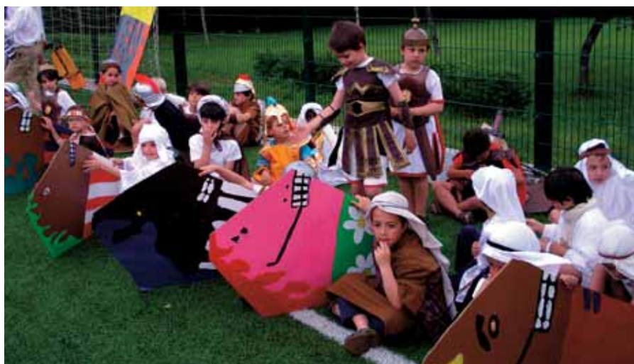
Los alumnos de 1º de Primaria preparados para la carrera de Ben-Hur.

hicieron disfrutar del mejor cine. Desde 1º EP hasta 6º y con un ves-