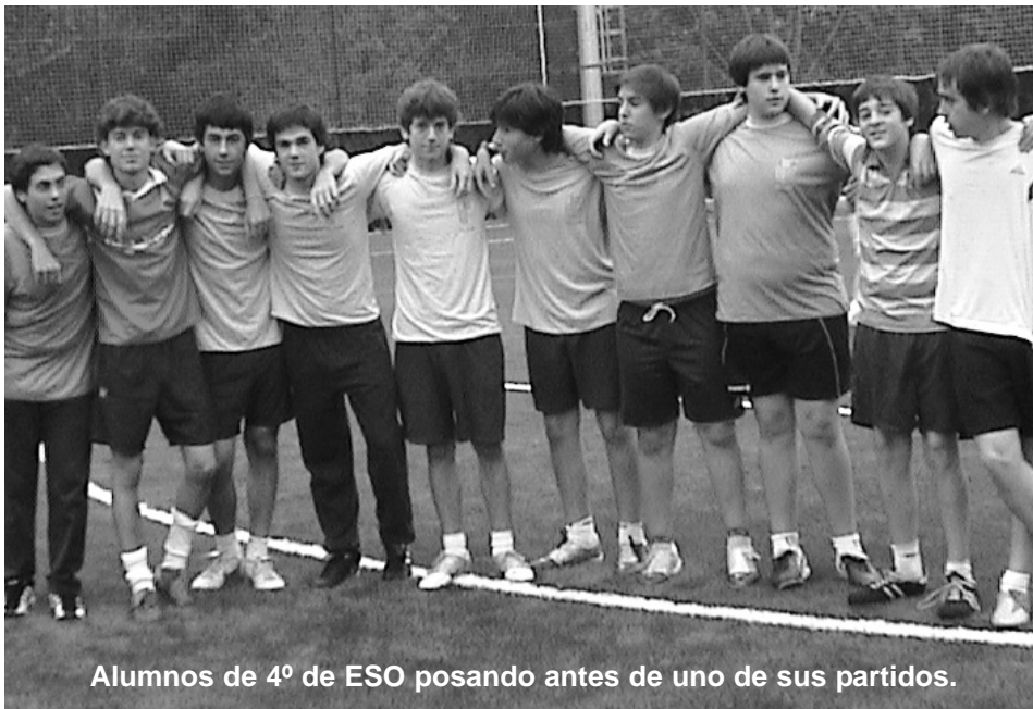
Alumnos de 4º de ESO posando antes de uno de sus partidos.

Bachillerato B, ganando en la final a los profesores por un ajustado 3-2. En la final de la 2ª división se enfrentaron los equipos de 2º ESO A contra 3º ESO A, esta final fue suspendida por el árbitro a 10 minutos para su conclusión por decisión técnica.