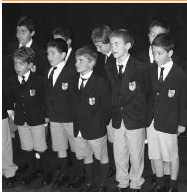
Alumnos de 4º EP durante su representación

Secundaria a escena. Esto quiero verlo. Es la primera vez que sale un número de primero y segundo de ESO en el festival. Hay que atar el árbol al soporte que se le ha roto una madera. Pienso en las horas que han dedicado los Borjas de 4º de ESO y alguno más a preparar todo el atrezzo. Suena la música. Se han equivocado sólo una vez. Ha quedado vistoso y muy simpático. Un éxito. Vaciar el escenario de todo el material. Una canción cortesía de un antiguo alumno.