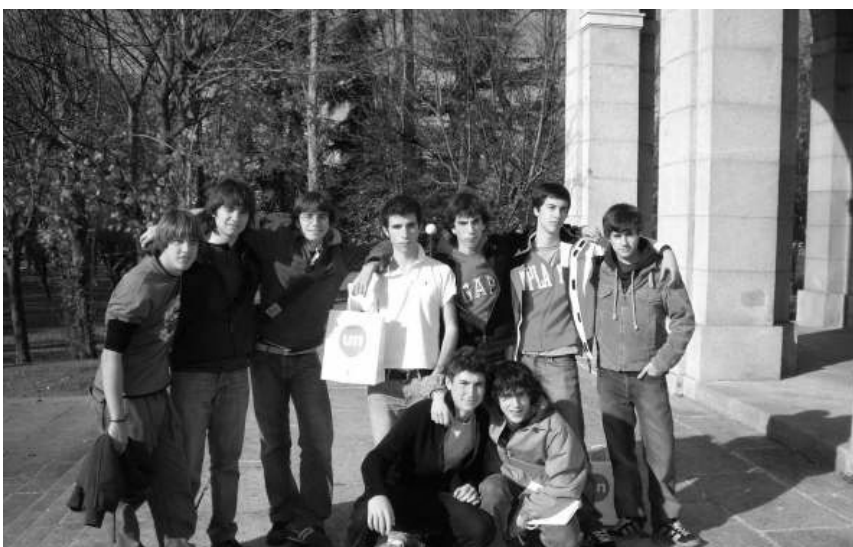
Foto de familia. No están todos los que son...

Dentro del Plan de Orientación universitaria del colegio, tuvieron la oportunidad de visitar el mes de noviembre la Universidad de Navarra. Allí conocieron más de cerca la vida universitaria: pasearon por las instalaciones, se sentaron en las aulas y comieron junto a alumnos del centro, algunos antiguos conocidos de Munabe.