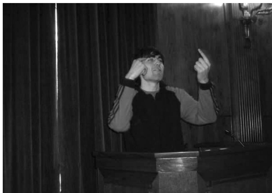
Alumno de letras. Algunos ya apuntan maneras.