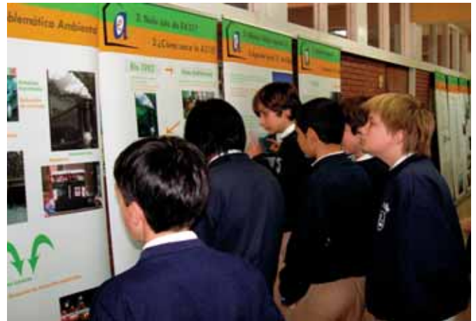
Alumnos de 1º ESO observando los paneles de la Agenda 21.

Creemos que puede ayudarnos a desarrollar nuestro proyecto de centro y porque es una de las actuaciones prioritarias en dónde el Gobierno Vasco quiere que los centros incidan.