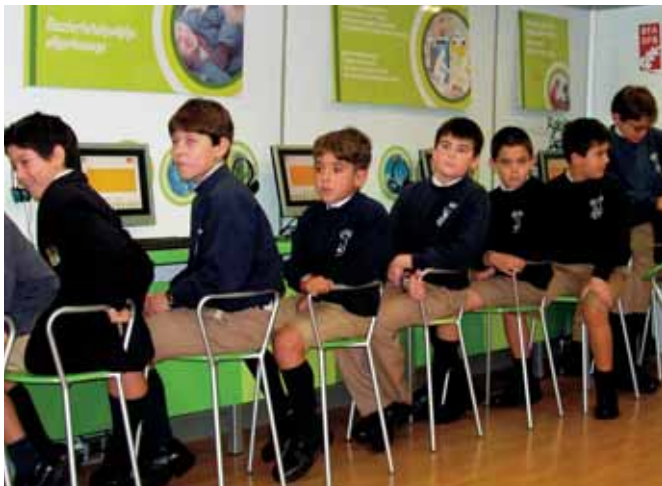
Alumnos de 5º Educación Primaria en el autobús verde.

La participación en la agenda 21 local-escolar nos permite establecer un mayor compromiso con la sostenibilidad de nuestro municipio.