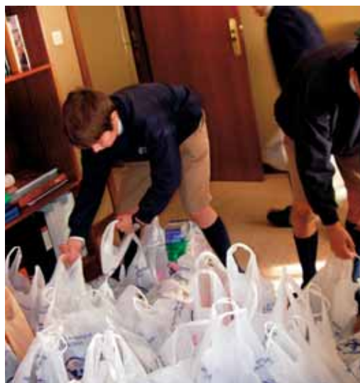
Alumnos de 6º EP recogiendo las bolsas.